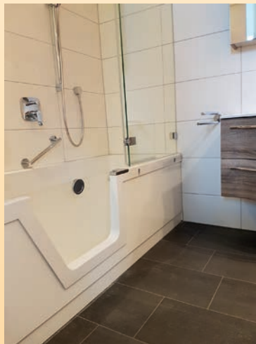
@ Alber GmbH bad&heizung

Zertifizierte Handwerksbetriebe kümmern sich und bieten schnelle und kompetente Beratung, bei der Sie sicher sein können, ein faires Angebot und eine baldige Umsetzung zu erhalten.